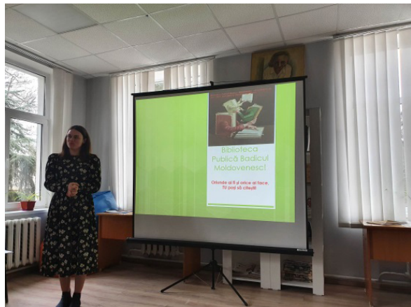
Prezentarea serviciului „Oază de lectură”, BP Badicul Moldovenesc, raionul Cahul, 2023