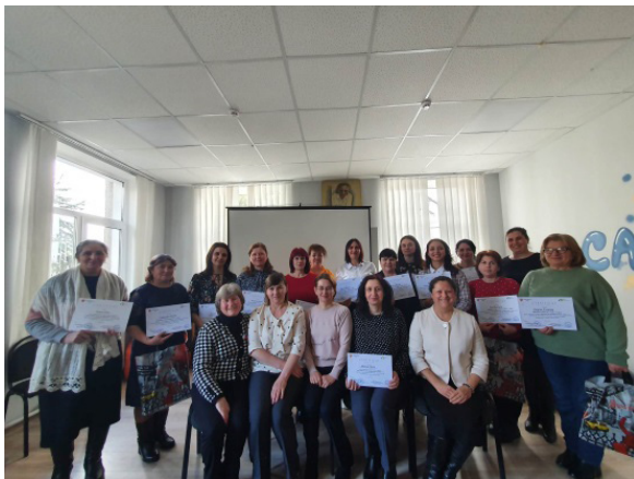
Participanții la Gala Bibliotecilor, 2023

La finele evenimentului, Secția Cultură Cahul a oferit premii și diplome pentru participanți. Este important să remarcăm că evenimentul a avut un impact deosebit pentru întreaga comunitate bibliotecară din rețea.