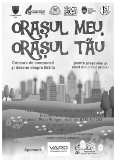
Figura nr. 2. Afiș. Proiect educațional internațional

creativi, chiar dacă sunt la sute de kilometri distanță... din Suceava, Brașov, Caraș-Severin, Tulcea, Dâmbovița, Republica Moldova sau chiar din Spania. De mai bine de 7 ani, Orașul meu, orașul tău reușește să promoveze valorile locale prin cei mai sinceri ambasadori, copiii noștri, arhitecții de mâine ai orașului meu și al tău, al orașului nostru. De ce e necesar acest proiect? Pentru că avem nevoie de sinceritatea și naivitatea copiilor, care spun lucrurilor pe nume, să ne dăm seama cât suntem de norocoși. Fiecare oraș implicat în acest proiect este cel mai frumos din țară. Ce îl face frumos, ce îl face să fie aparte? Ei bine, noi cei care locuim în el. Fiecare bibliotecă parteneră va trimite bibliotecii organiza-