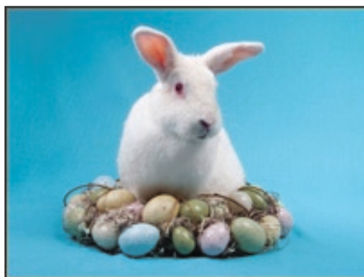
Iepurașul e menționat prima dată ca simbol al Paștelui într-o scriere germană din secolul 16

De-a lungul anilor, iepurașul a devenit o imagine asociată sărbătorii de Paște în tot mai multe țări. Grație înclinației spre reproducere a acestui animal, iepurele e văzut și ca un simbol al fertilității.