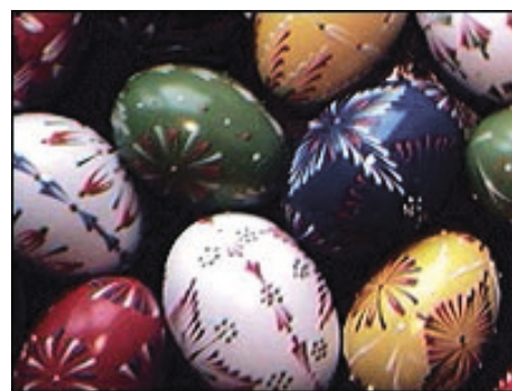
Ouăle sunt simboluri ale unei vieți noi, ale fertilității