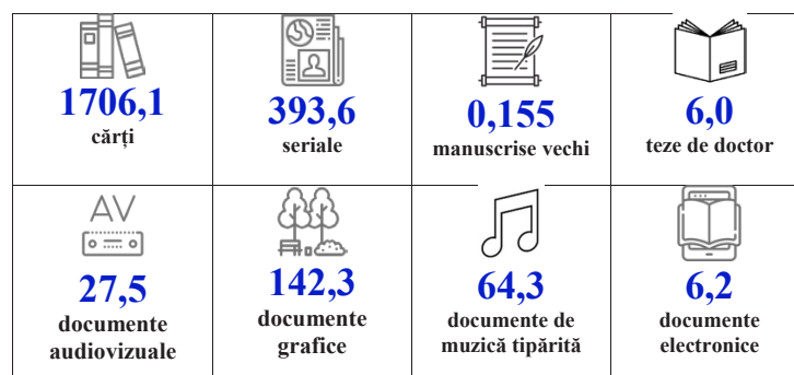
Figura 2. Structura colecțiilor după tipuri de documente (mii u.m.)

cărțile și publicațiile seriale (85,9%), urmată de documentele grafice și documentele de muzică tipărită.