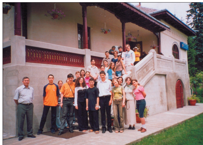
Participanții la Concursul “La izvoarele înțelepciunii” la Casa-muzeu “Mihai Sadoveanu” din jud. Neamț (casa lui Visarion Puiu)

1 Soarele Moldovei. 1504-2004 . – Iași: Optima, 2003. – P. 13