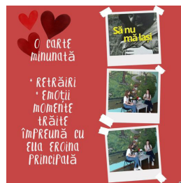
Start campaniei „Satul meu citește o carte”