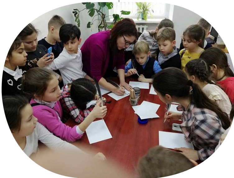
Secvență de la atelierul de scriere interactivă, din cadrul serviciului Școala altfel

O altă formă de promovare a cărții în cadrul Muzeului Cărții este serviciul modern Școala altfel [4], în agenda căruia sunt incluse activități participative interactive și experiențe informale de învățare, specifice turismului educațional, precum programele educative și ateliere de scriere interactivă, structurate într-o ofertă educațională actualizată trimestrial și desfășurate gratis, la solicitare. Formatul programelor educative pleacă de la necesitatea abordării prin dialog a unor teme relevante pentru școală sau liceu prin intermediul discuțiilor deschise, care contribuie la formarea capacităților