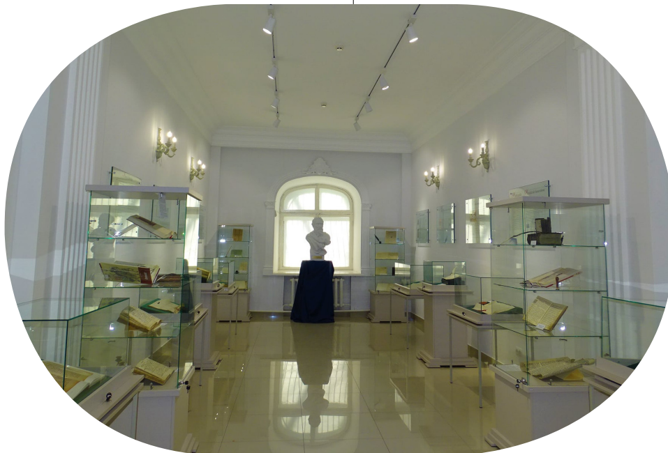
Muzeul Cărții, aspect interior

desfășurarea activității turistice în Republica Moldova , este obiectiv turistic de importanță națională [5]. Creșterea colecțiilor patrimoniale de unicat, interesul și grija față de valorificarea patrimoniului documentar contribuie la identificarea unor noi forme și metode inovatoare de promovare și valorificare a patrimoniului cultural. În acest context Biblioteca Națională a Republicii Moldova a conceput și deschis, la 14 iunie 2018, spațiul expozițional Muzeul Cărții în cadrul secției Carte veche și rară, misiunea căruia este axată pe promovarea și valorificarea mărturiilor trecutului, exprimate prin cea mai măreață invenție a umanității – cartea, ca obiect de unicat al patrimoniului cultural [3].