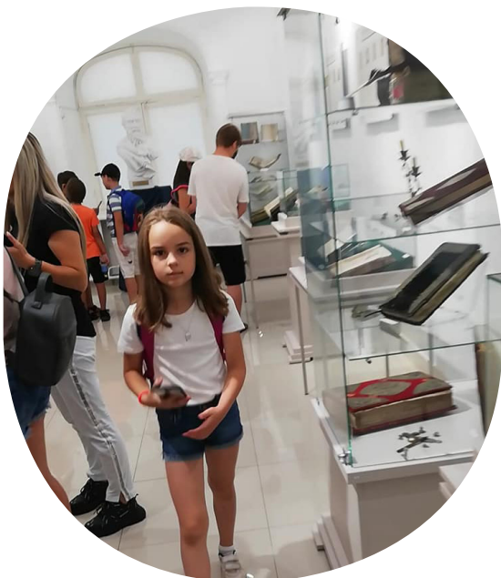
Ghidaj informativ în cadrul serviciului Biblioturism

învățare permanentă și un mediu pentru inspirație.