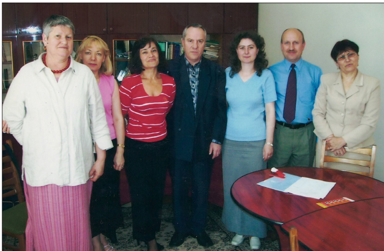
Comisia de atestare a personalului de specialitate din bibliotecii, 2006