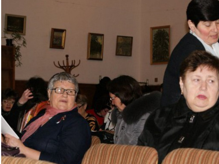
Simpozionul Științific Anul Bibliologic, 18 martie 2011