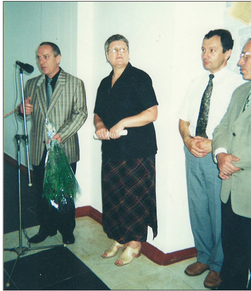
Inaugurarea SBM, 29 iunie 2001