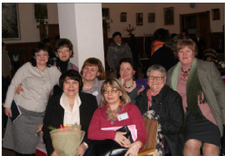
Simpozionul Științific Anul Bibliologic 2010