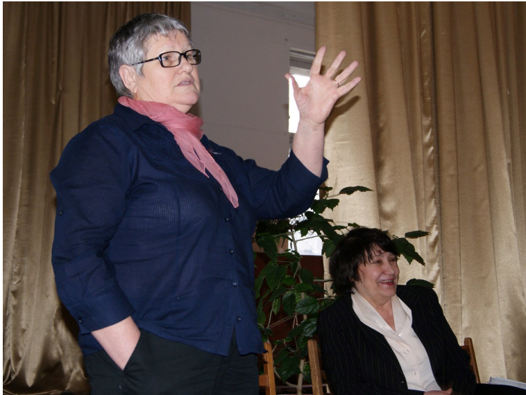
Simpozionul Științific Anul Bibliologic, 18 martie 2011