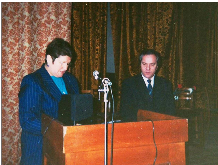
Seminarul Național, 1997