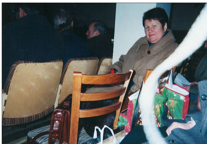
18 decembrie 1997