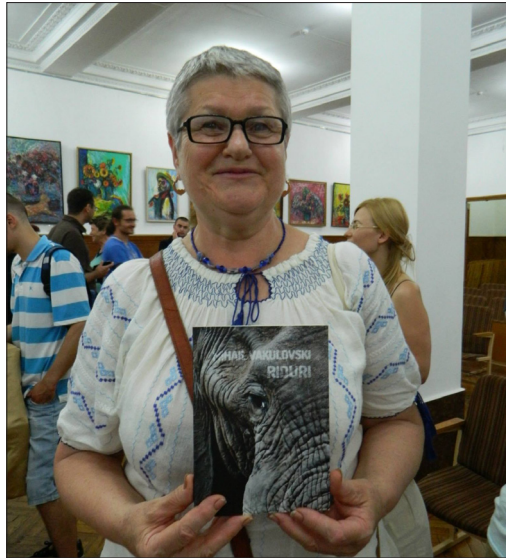
16 august 2014