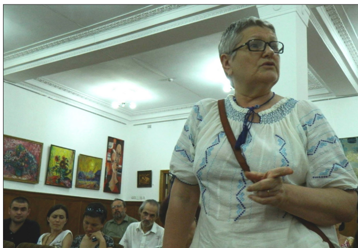
16 august 2014