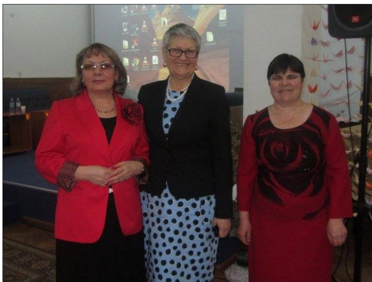
Simpozionul Științific Anul Bibliologic, 31 martie 2016