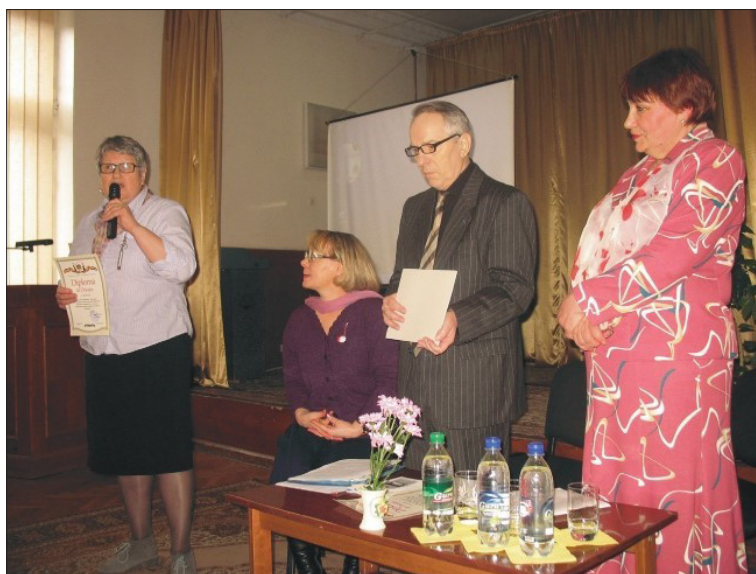
Simpozionul Științific Anul Bibliologic 2009