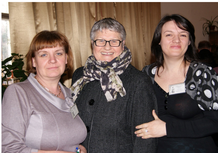
Simpozionul Științific Anul Bibliologic, 18 martie 2011