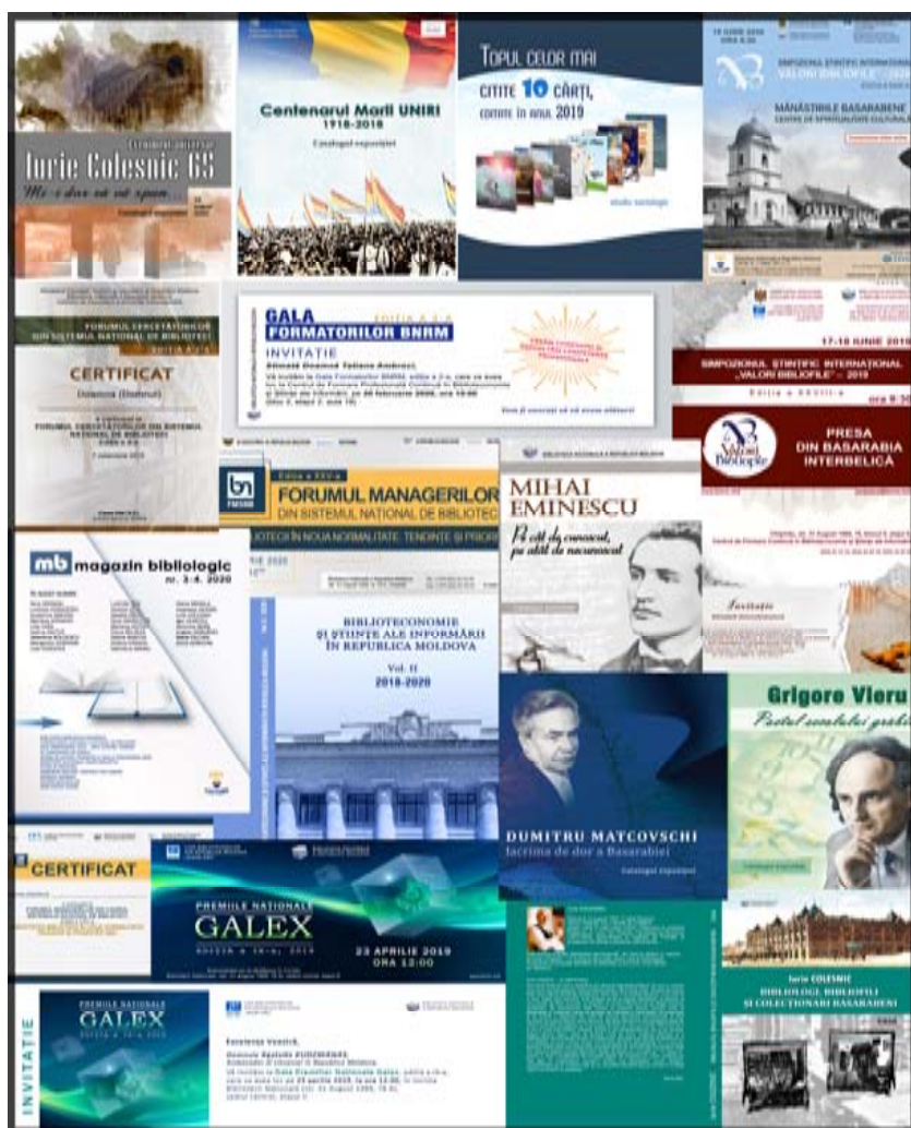
Copertile cărților și a materialelor promoționale prezentate artistic

➤ portofoliul de publicații al BNRM continuă să pună la dispoziția specialiștilor din domeniul biblioteconomiei și științe ale informării - o gamă diversificată de publicații, disponibilă în format tipărit și electronic.