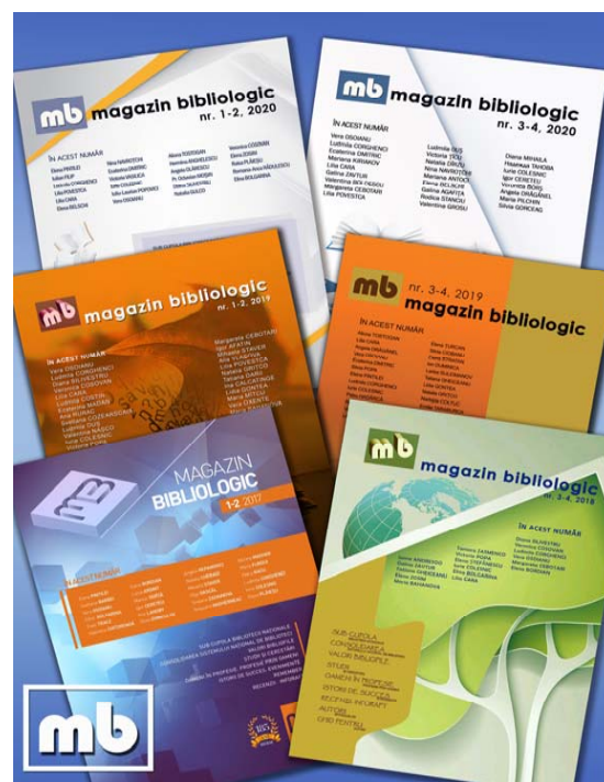
Din colecția revistei Magazin bibliologic

În ultimii ani, remarcăm că din Colegiul de redacție al revistei Magazin bibliologic fac parte nume notorii care contribuie nemijlocit la îmbogățirea calității publicației.