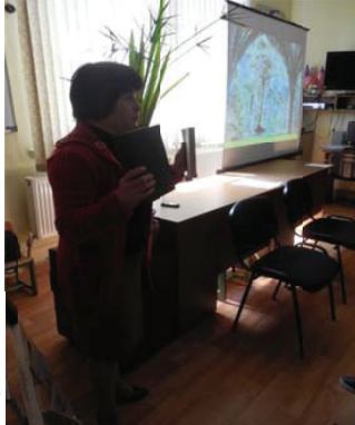
Литературно-музыкальная композиция «Вечный солнечный свет в музыке» к 260-летию Вольфганга Амадея Моцарта