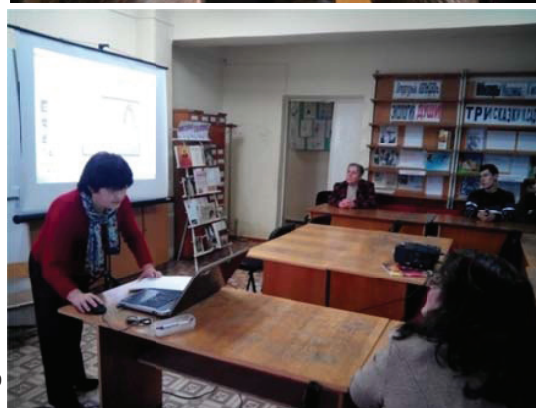
Литературно-музыкальная композиция «Неповторимый голос Марии Биешу»