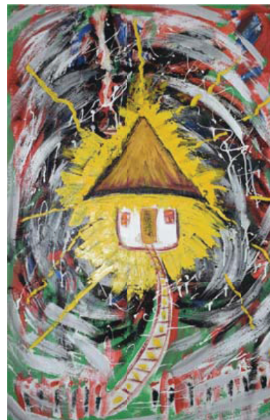
Filip, Iulian. Clopotul Acasei : Pictură pe pânză, guași

În 2007 s-a desfășurat în premieră, la Biblioteca Științifică, Conferința anuală a ABRM, unde au participat mai bine de 200 bibliotecari din diferite tipuri de biblioteci din republică și România.