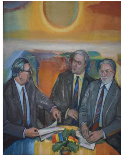
Florescu, Ștefan. Portret de grup. Pictură în ulei pe pânză

totodată „amprenta fotografică reală” și „trăsătura de penel abstractă-decorativă” se intersectează reciproc la margini, în jurul personajelor și/sau a/ale părților sale.”