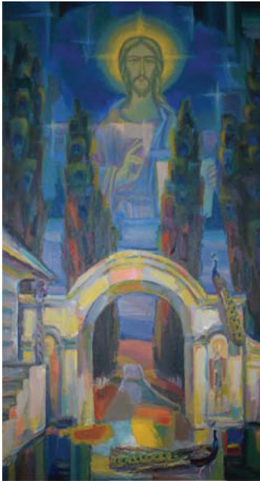
Florescu, Ștefan. Lumina. Pictură în ulei pe pânză

„Cum să redai Lumina Divină de asupra Porților Paradisului, pentru a nu repeta realizările pictorilor precedenți? Pictorul aplică procedeul compoziției „Simetria”, măbind chipul Mântuitorului până la dimensiunile neobișnuite ale unui Uriaș. Și aici Șt. Florescu mizează pe cunoștințele spectatorilor-creștini. Iisus Hristos binecuvântează Porțile Raiului unind cele trei degete (cel mic, cel inelar, cel mare), amintindu-ne de Sfânta Treime – Dumnezeu Tatăl, Dumnezeu Fiul și Dumnezeu Sfântul Duh. Necunoscând simbolul „conformației degetelor”, percepția nimbului Luminii îi scapă Spectatorului.