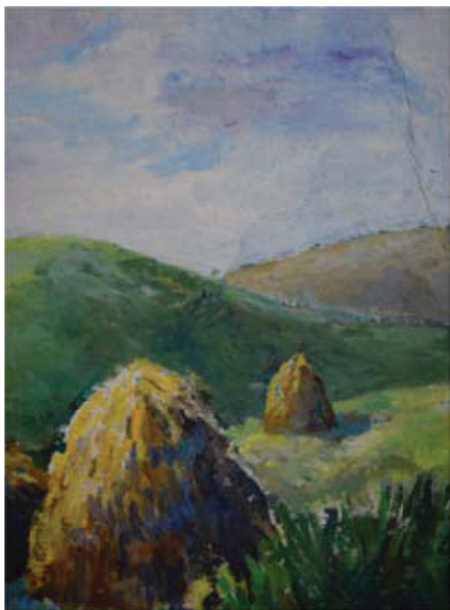
[Vara] : Pictură pe carton