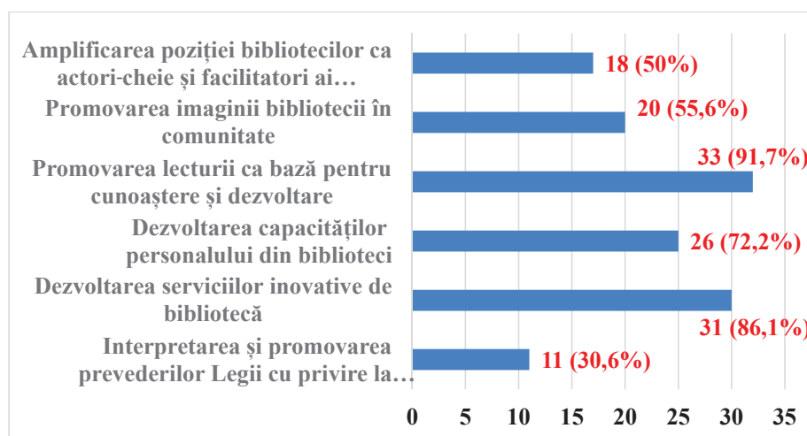
Imaginea 1. Identificarea Priorităților, Zona 1 (Nord)