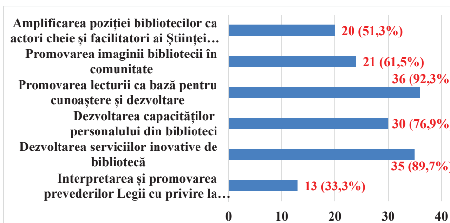
Imaginea 4. Identificarea Priorităților, Zona 4 (Sud)

Una din întrebările formulate a vizat identificarea problemelor, dificultăților cu care se confruntă personalul de specialitate în implementarea Priorităților anului 2020 . În baza analizei răspunsurilor, principala problemă cu care s-au confruntat bibliotecarii a fost situația epidemiologică din țară, care a provocat perturbări și modificări în activitatea profesională. Printre cele mai evidente dificultăți în implementarea Priorităților anului 2020 au fost menționate: